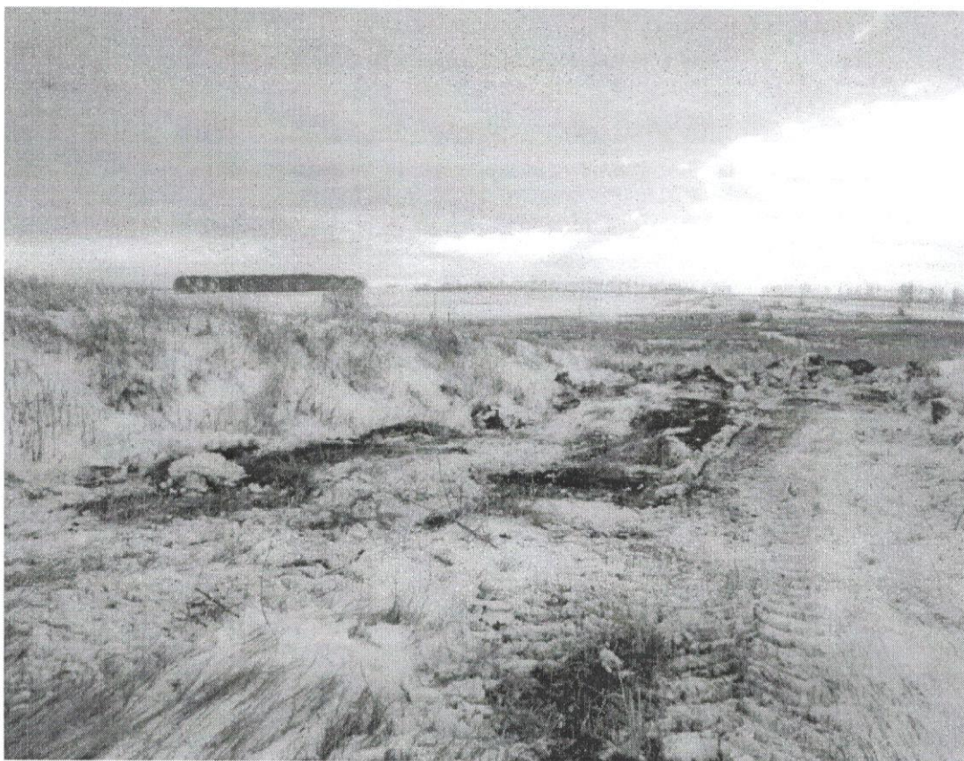
Фото 1 - в 200 метрах восточнее с.Покровка 52.697128 с.ш. 55.909160 в.д.

Старший государственный инспектор, председатель Мелеузовского территориального комитета Минэкологии РБ – начальник отдела (должность)